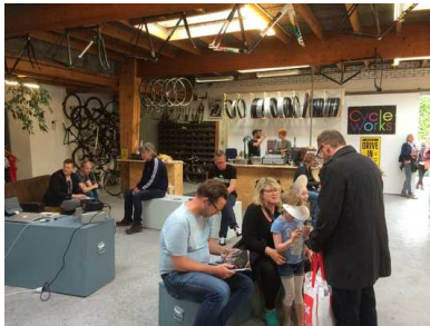
De nieuwe wielwinkel Cycle Works.