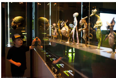
STAR WARS IDENTITIES