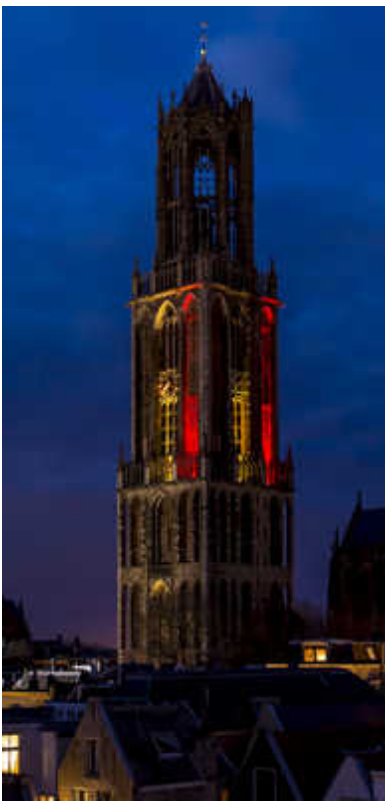
De Domtoren had gisteravond de kleuren van de Belgische vlag. ERIK VAN 'T WOUDE