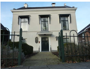
Het ouderlijk huis van Dick Bruna aan de Utrechtseweg in Zeist.