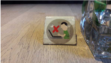
In Bar Beton in Utrecht staat op enkele tafels een verbodsbordje.