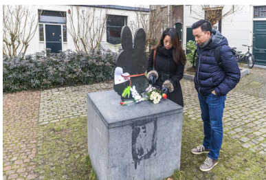
Bloemen bij het museum