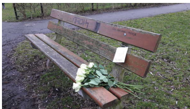
Bloemen op zijn vaste bankje.