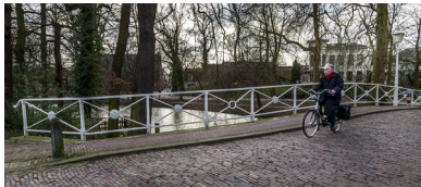
Altijd op de fiets naar zijn atelier