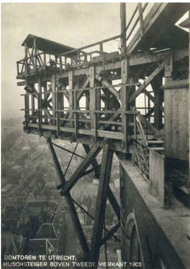
De Domtoren tijdens de restauratie in 1902.