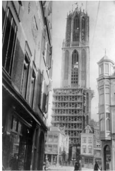
De Domtoren in 1924.

De Domtoren, icoon van Utrecht, is toe aan groot onderhoud. Niet voor het eerst; in de 19de eeuw stond de 112 meter hoge toren zelfs op instorten.