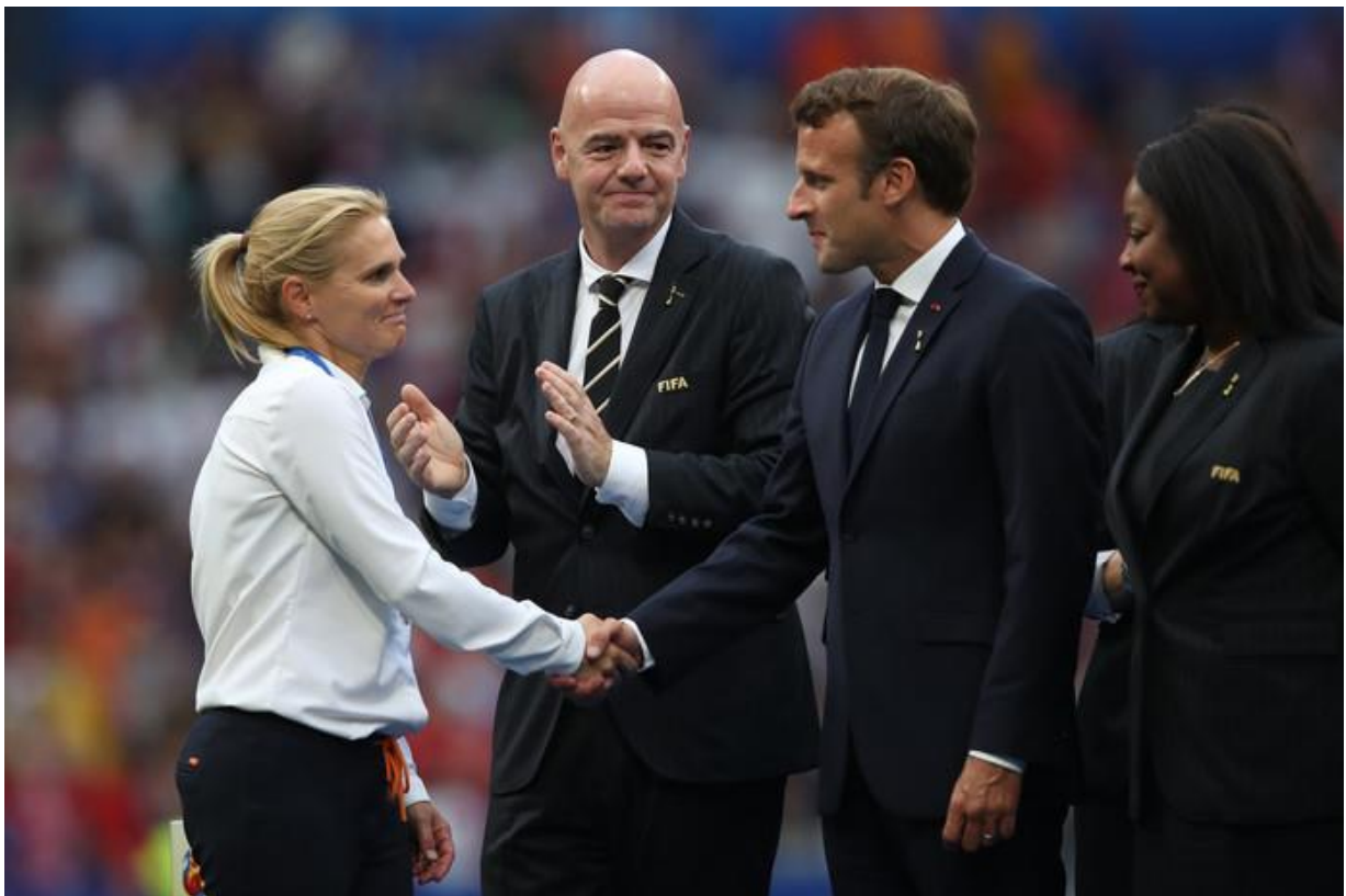
FIFA-baas Gianni Infantino en de Franse president Emmanuel Macron zijn complimenteus voor Sarina Wiegman.

De bondscoach leverde een enorme prestatie. Na de Europese titel van 2017 selecteerde Wiegman bewust niet door. Ze had vertrouwen in de groep speelsters met wie ze al zo lang werkt. En de Haagse kreeg gelijk. Ze viel dit toernooi ook op door haar scherpste en ontspannenheid tijdens persconferenties. Inmiddels is ze een bekende Nederlander en een waardig ambassadeur van het vrouwenvoetbal in ons land.