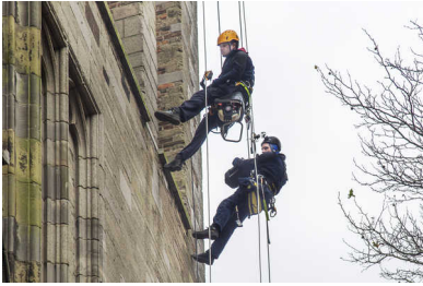
De Monumentenwacht inspecteert de Domtoren zeer geregeld. Dat krijgt de voorkeur boven een dure steiger.