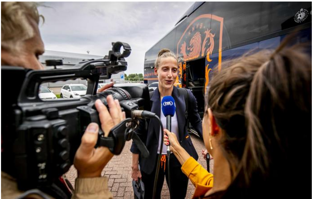
Sari van Veenendaal.

Nu is het elke keer aanpassen. Al ziet de KNVB er juist ook de voordelen van in om ‘niet elke avond naar hetzelfde behangetje te hoeven kijken’. Bovendien: de mannen van Oranje hadden tijdens het EK van 2012 een basiskamp in Polen, terwijl ze speelden in Oekraïne. In het holst van de nacht vlogen ze na de wedstrijd terug. Tot hun grote ongenoegen. Maar u raadt het al. Dat EK was een mislukking. Klagen over de omstandigheden gebeurt alleen bij slechte resultaten. Dat zal hier in Frankrijk niet anders zijn.