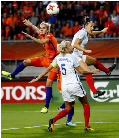
Vivianne Miedema klopt twee Engelsen in de lucht en zet Oranje op 1-0.